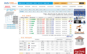
해양 조석 정보 및 기상 제공 솔루션