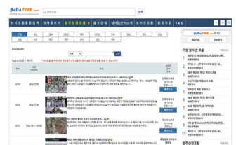
뉴시 선박 부킹 및 결제 솔루션