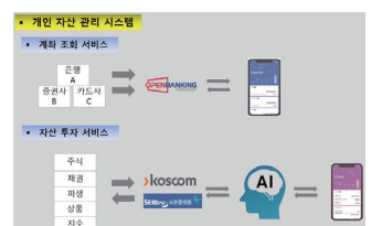
자산 관리 솔루션