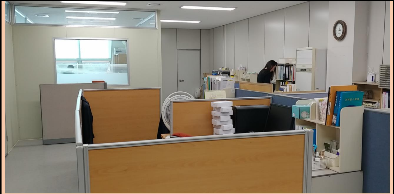
대표님과 행정 전반을 관리하는 김 대리님이 클라우드펀딩 서류 작성에 분주한 모습~